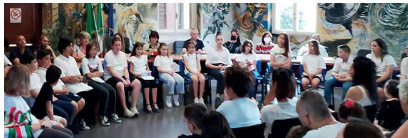
• Sabato 28 maggio 2022, una data storica: l'insediamento del "Consiglio Comunale dei Ragazzi" di Zibido San Giacomo.

« IL CONSIGLIO Comunale dei Ragazzi (CCR) è un organismo pensato per favori-