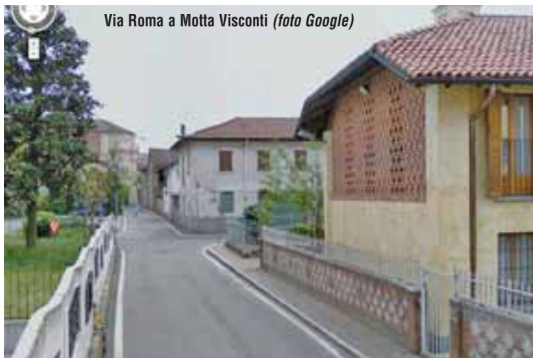
Via Roma a Motta Visconti