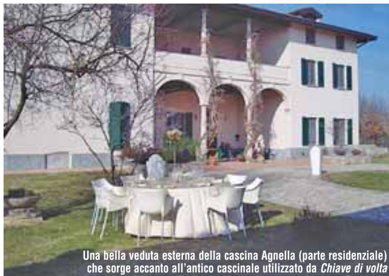
Una bella veduta esterna della cascina Agnella (parte residenziale) che sorge accanto all'antico cascinale utilizzato da Chiave di volta