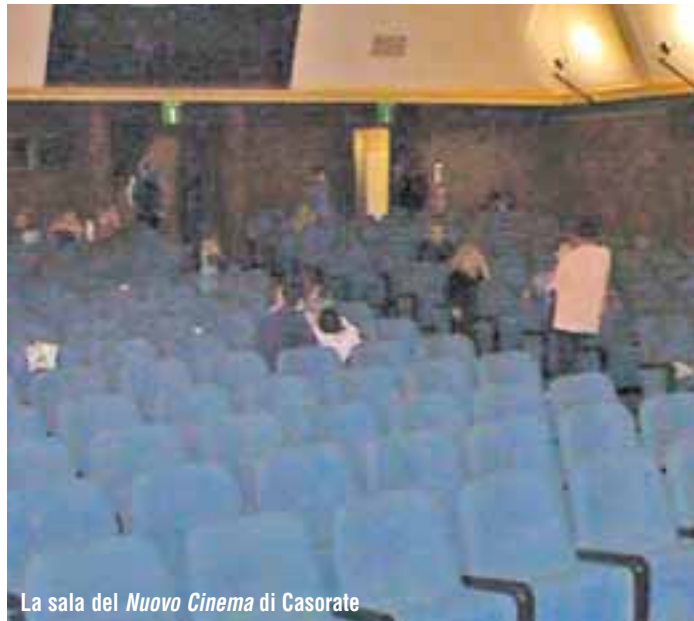
La sala del Nuovo Cinema di Casorate