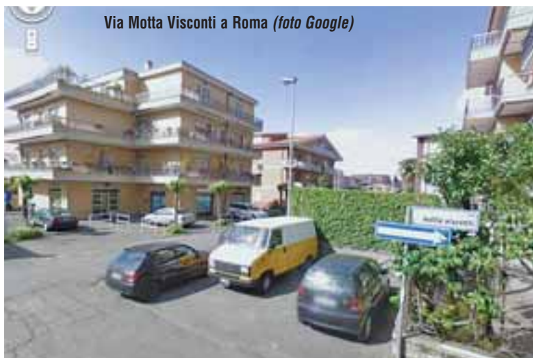
Via Motta Visconti a Roma

Il Consiglio comunale di Motta Visconti ha approvato l'importante riconoscimento simbolico per tutti i minorenni non italiani residenti nel territorio comunale