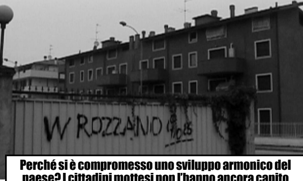
Uno scorcio di via Fiume, angolo via del Cavo.

Perché si è compromesso uno sviluppo armonico del paese? I cittadini mottesi non l'hanno ancora capito