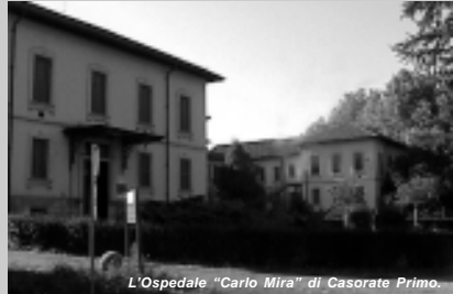
L'Ospedale "Carlo Mira" di Casorate Primo.