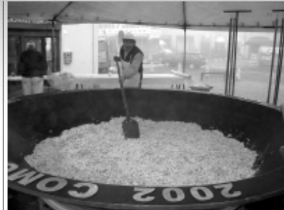
La "Pentola Benefica", a cura degli Amici di Ossona, cuocerà un'altrettanto gigantesca trippata

Le iniziative gastronomiche sono organizzate dal Gruppo Don Michele insieme a Pro Loco, Contrada Sant'Antonio, col patrocinio del Comune