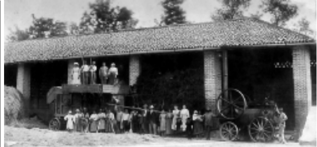
laboratori dell'uomo, ma sopra ogni cosa, appaiono scorci del grandioso palcoscenico naturale - anch'esso ridotto e manomesso - sul quale l'uomo della

Della rassegna fotografica, fanno parte oltre agli arnesi utilizzati nelle varie esigenze di lavoro, le prime attrezzature, gli animali, pazienti ed infaticabili col-