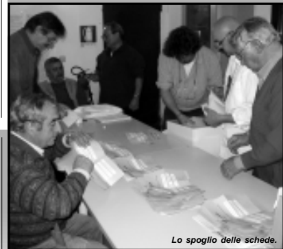
Lo spoglio delle schede.