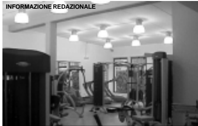
E' ormai tutto pronto per la grande inaugurazione di FitFactory, la nuovissima palestra di Motta Visconti, in piazza Del Maino, 1/b: ecco le primissime immagini del Centro che apre SABATO 22 OTTOBRE!