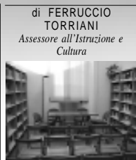
di FERRUCCIO TORRIANI Assessore all'Istruzione e Cultura

Egregi Genitori, Vi invitiamo con il vostro bambino ad una serie di due incontri (il primo dei quali già svoltosi la mattina di sabato 15 ottobre scorso, n.d.r.) rientranti nel progetto "Nati per leggere" che si pone l'obiettivo di promuovere la lettura ad alta voce ai bambini di età compresa tra i 6 mesi e i 6 anni di età. La stimolazione e il senso di protezione che genera nel bambino il sentirsi accanto un adulto che racconta storie già dal primo anno di vita e condivide il piacere del racconto è impareggiabile.