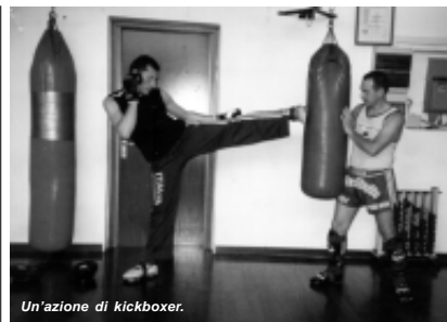
Un'azione di kickboxer.

Appuntamento alla palestra delle Scuole Medie