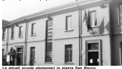
Le attuali scuole elementari in piazza San Rocco.

AMMINISTRAZIONE COMUNALE di Motta Visconti