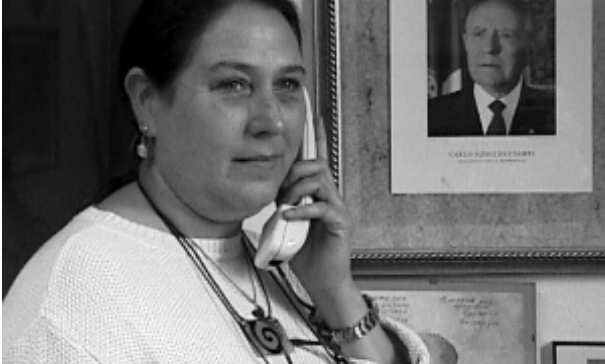
«NIENTE POSA DELLA PRIMA PIETRA, NOI LAVORIAMO»