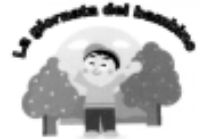
Il logo della prima "Giornata del Bambino"

Conosciamo la Sua sensibilità, la Sua attenzione ai giovani e il Suo instancabile impegno nell'affermare e mantenere vivo il rispetto per le regole e i valori della democrazia. (...) Fiduciosi di poter ricevere la Sua visita, desideriamo trasmetterLe la nostra stima e porgerLe i nostri più sentiti saluti.