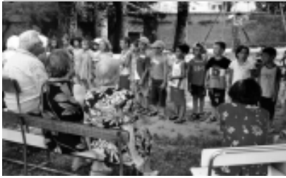
a cura delle EDUCATRICI della "Cooperativa Lo Scrigno"

Tutte le attività proposte ruotavano intorno al "Villaggio degli Indiani d'America"