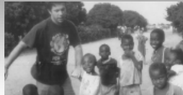
Nella foto, un collaboratore di Don Michele con alcuni bambini della missione in Zambia.

L rientro in Italia di Don Michele Crugnola dallo Zambia per un breve periodo di vacanza, ci ha permesso di condividere l'impegno missionario di una discreta presenza missionaria in quella terra. Nel Saloncino Parrocchiale "Don Severino Maestri" la comunità parrocchiale ha ascoltato con vivo interesse le notizie espresse da Don Michele sulla parrocchia di Savionga dove opera dal 2001.