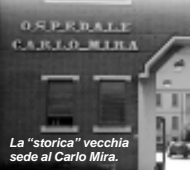
La "storica" vecchia sede al Carlo Mira.

D omenica 21 novembre verrà inaugurata la nuova sede della Croce Rossa Italiana di Casorate Primo che si sposta in via Matteotti 11, accanto alla CATO. Il programma della cerimonia, di cui vi avevamo dato un'anticipazione nel numero di ottobre, è il seguente: ore 9-9,30 arrivo dei partecipanti sul Sagrato della Chiesa Parrocchiale; ore 9,30 Arrivo delle Autorità; ore 10,00 Santa Messa; ore 10,50 Partenza in corteo verso la nuova sede; ore 11,00 Intervento delle Autorità. Seguirà il taglio del nastro, con visita della struttura e relativo rinfresco.