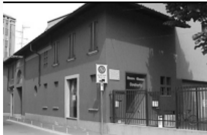
«Sono i Volontari che tengono in piedi l'Oratorio, la Caritas e il Cinema»

«Spesso ho l'impressione che né le istituzioni né molte persone sappiano cosa facciamo. Qui ci vuole una presa di coscienza»