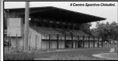
Il Centro Sportivo Chiodini.