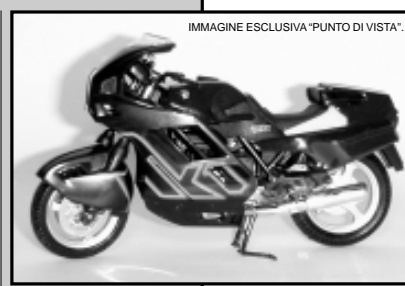
IMMAGINE ESCLUSIVA "PUNTO DIVISTI".

www.modellismopavese.it punto di incontro e di informazione per tutti gli appassionati. Se siete interessati a scoprire e avvicinarvi all'affascinante mondo del modellismo, vi ricordiamo che il CMP Club Modellismo Pavese è un vero club di amatori del modellismo con sede ufficiale nel Castello di Bereguardo; vi aspettiamo in occasione delle prossime riunioni che si terranno il 22 novembre ed il 13 dicembre alle h 21.