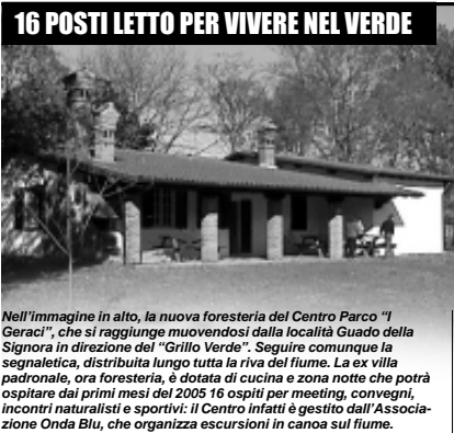
16 POSTI LETTO PER VIVERE NEL VERDE Nell'immagine in alto, la nuova foresteria del Centro Parco "I Geraci", che si raggiunge muovendosi dalla località Guado della Signora in direzione del "Grillo Verde". Seguire comunque la segnaletica, distribuita lungo tutta la riva del fiume. La ex villa padronale, ora foresteria, è dotata di cucina e zona notte che potrà ospitare dai primi mesi del 2005 16 ospiti per meeting, convegni, incontri naturalisti e sportivi: il Centro infatti è gestito dall'Associazione Onda Blu, che organizza escursioni in canoa sul fiume.